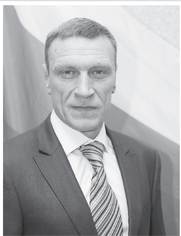
Глава МО Невская застава