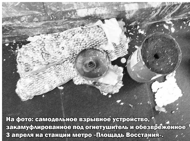
На фото: самодельное взрывное устройство, замаскированное под огнетушитель и обезвреженное 3 апреля на станции метро «Площадь Восстания».