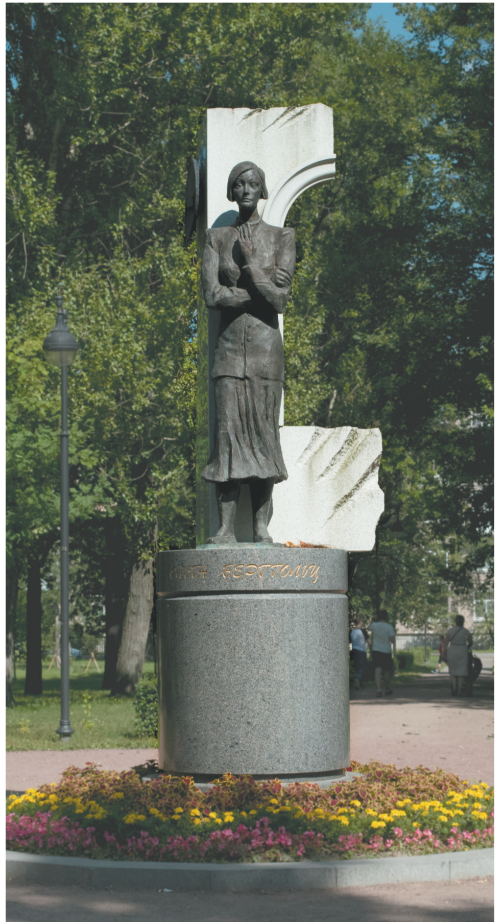
Памятник Ольге Берггольц в Палевском саду.

Памятная доска со списком погибших сотрудников Объединенной киностудии научно-технических и хроникально-документальных фильмов находится в здании, занимаемом киностудией «Леннаучфильм» (Мельничная ул., 4). В старом заводе управления ОАО «ЛКХП Кирова» (пр. Обуховской Обороны, 45), на главной лестнице, обу-