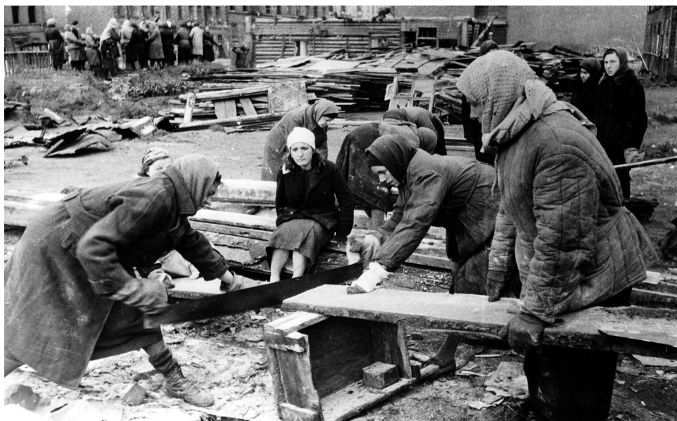
Заготовка дров в блокаду на проспекте Села Смоленского (Обуховской Обороны).

Вдруг дверь в убежище распахнулась, с улицы стали прибегать дети, приходят взрослые, некоторые раненые, окровавленные. Пришлось оказывать им первую помощь. Вид крови всегда вызы-