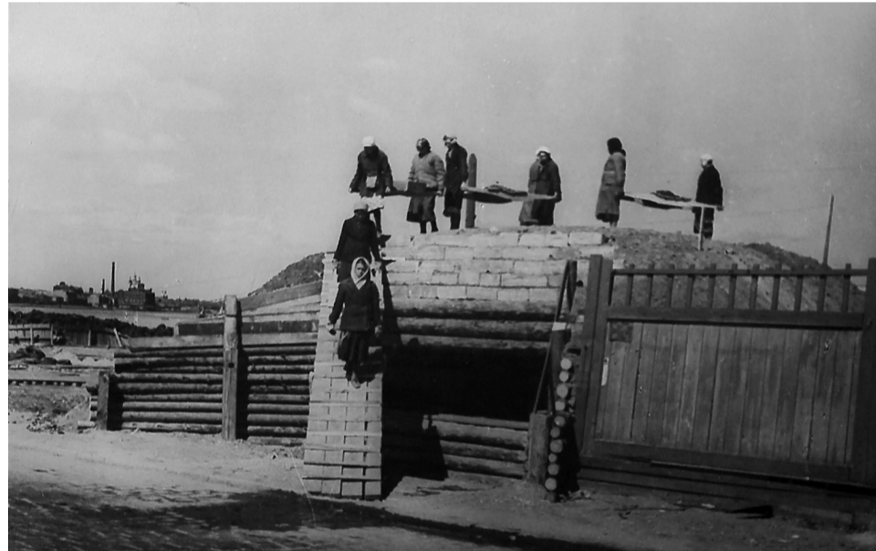
Постройка ДЗОТа в районе пересечения Шлиссельбургского (Обуховской обороны) проспекта и Обводного канала.

Я вышла во двор наш, взглянула на сад — он был прекрасен в злато-