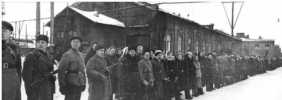
Бойцы рабочего батальона Невского завода имени Ленина.

Представляем отрывки из воспоминаний ленинградцев, которые в годы блокады жили и трудились за Невской заставой.